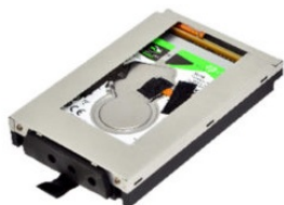
Быстросъёмная корзина с накопителем