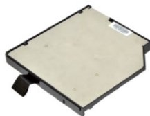
Быстросъёмный накопитель в слот Media-Bay