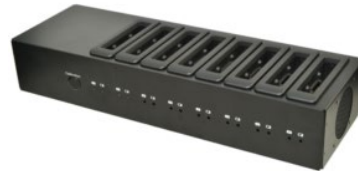
Зарядное устройство на 8 батарей