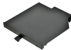
Съёмная дополнительная батарея в слот Media-Bay