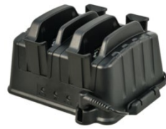
Зарядное устройство на 2 батареи