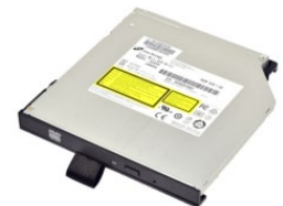
Съёмный DVD Super Multi