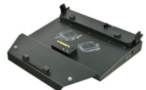
Док-станция для офиса